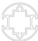
POTEAU 2 VOIES